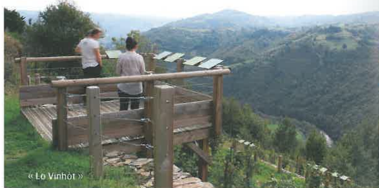
« Lo Vinhôt »

« L'ESPACE MARCELLE CAYRON » This is an adorable little museum of local life. The vines and wine making, navigation on the river Lot, honey and beeswax, chestnuts... the daily life of the village as it was is described and illustrated by a fascinating collection of objects, tools, photos and texts offered by many of the local inhabitants. One particular curiosity : a wax press! The ground floor is accessible to visitors with limited mobility. The visit is free and open all year round.