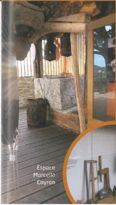
Espace Marcelle Cayron

La vigne, le vin, la navigation sur le Lot, le miel et la cire, la châtaigne... le quotidien du village autrefois est visité avec une collection d'objets, des photos et des textes, issus de l'occitan, recueillis auprès des habitants. Une curiosité : le pressoir à cire. RDC de plain-pied accessible aux personnes à mobilité réduite (panorama sur la vallée du Lot, tables ombragées). Réalisation juillet 2015. Visite libre. Toute l'année.